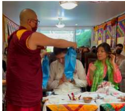
Ceremonia de bendición auspiciosa para parejas en Cuernavaca, y en Drepung Loseling México, 2022.