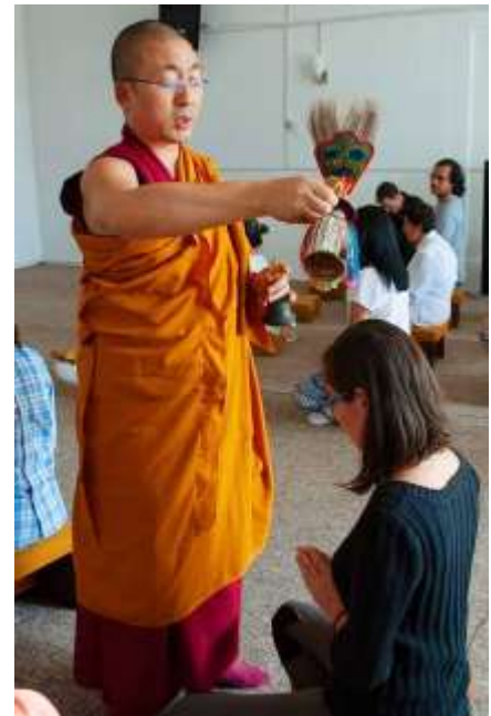
Puya de Humo impartida en Xochimilco México 2022 / Ceremonia de Vajravidharan impartida en Puebla, México 2018.