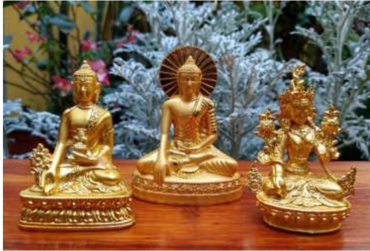
Estatuas de Budas del proyecto de donativos Tesoros del Himalaya, 2022.

23.*RIWOSANGCHÖ: PUYA DE HUMO - La Ceremonia de humo es un ritual muy efectivo que consiste en quemar varios tipos de inciensos y sustancias. Es una práctica de generosidad y ofrenda que libera el corazón e inspira la generosidad, de prosperidad que trae confianza y de sanación a través de la cual se saldan todas las deudas kármicas y sanan las relaciones.